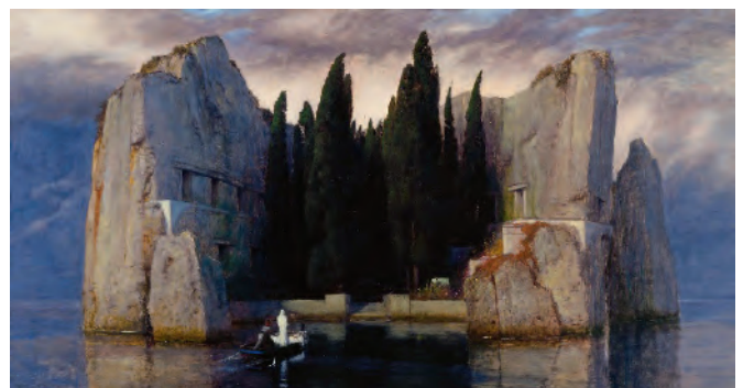
Arnold Böcklin, L'isola dei morti

Molti di loro attraversano inquieti l'intera vita nell'ardua ricerca di dare forma e colore a emozioni, stati d'animo o a condizioni percepibili solo dai sensi,