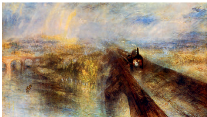
William Turner, Pioggia, vapore e velocità

A questi si contrappongono le ossessioni di Monet , Turner , e lo sfortunatissimo Van Gogh (ne cito solo tre fra i più noti). Nella casa rurale di Monet, a Giverny, il giardino è comprimario dell'acqua; ruscelli, stagni, ponticelli di sapore nipponico invitano a immaginare il caparbio pittore mentre coglie lo sfavillio della luce sull'acqua durante le ore del giorno; per Monet l'acqua fu, per tutta la vita, tormento e esaltazione. Le gigantesche tele delle Ninfee esposte al Moma di New York disorientano il visitatore, i più determinati si spostano da una estremità all'altra nella speranza di cogliere l'angolazione perfetta.