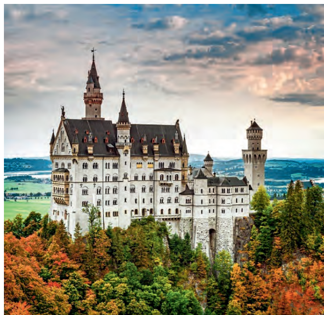
Castello di Neuschwanstein

Da noi in Italia non mancano castelli incantevoli come il castello di Fenis, quello di Ivrea, di Miramare e, nella mia bella Sicilia, il castello di Sperlinga che ci mostra anche il carcere borbonico e la fucina per la lavorazione dei metalli. Ma qui a Neuschwanstein è l'atmosfera del tragitto che rende il tutto magico, arrivare con i cavalli e poi scendendo dalla carrozza incontrare...il mondo! Persone giovani e meno gio-