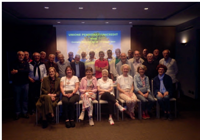
I Partecipanti al Consiglio Nazionale 2024

Infine per un migliaio di soci non sappiamo ancora se percepiscono la rendita del Fondo: si/no e se sono iscritti a UniCA: si/no.