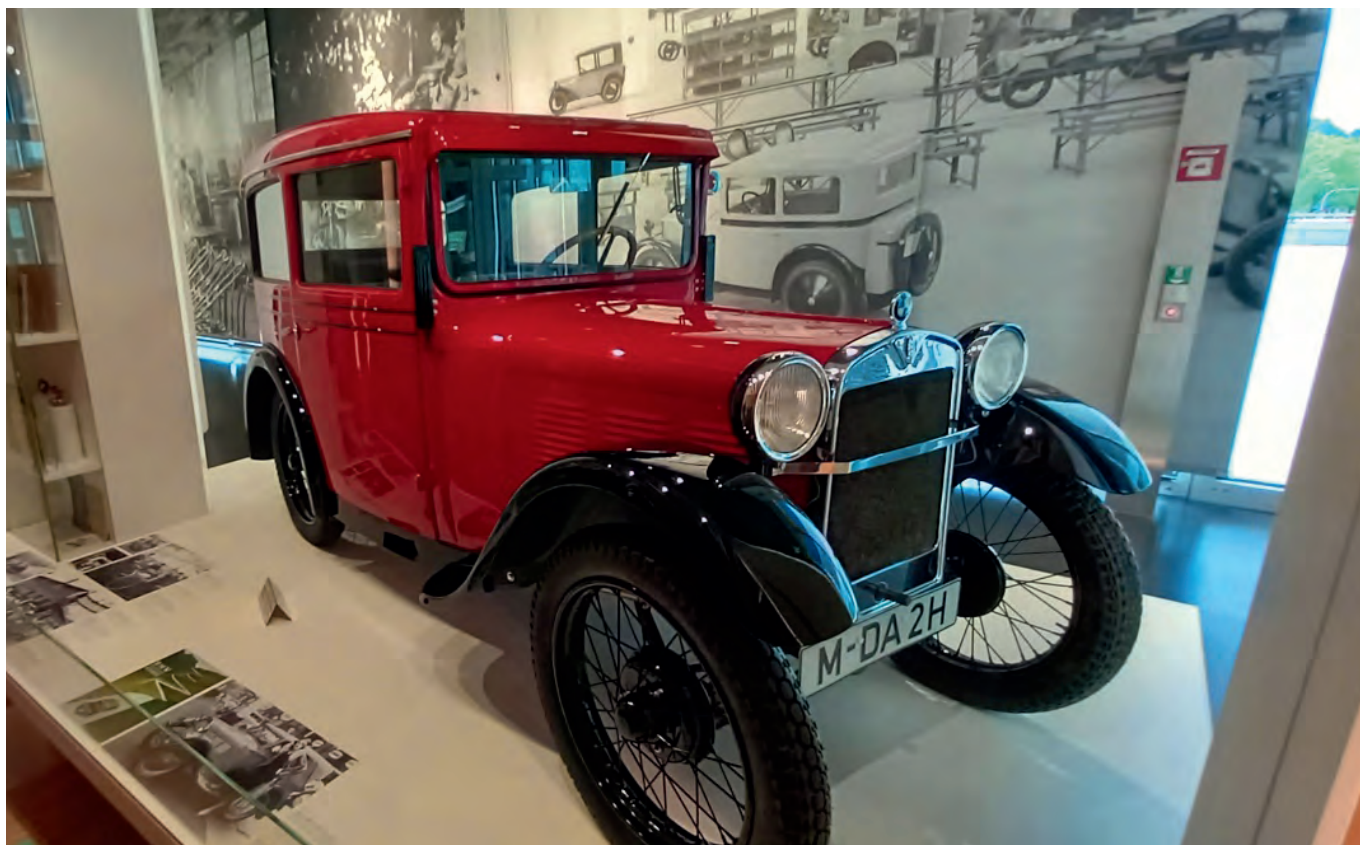
Uno scorcio del Museo BMW

Arrivati in Marienplatz (Piazza di Maria) vediamo la Mariensaule una colonna di marmo che sorregge la statua in bronzo dorato della Madonna, patrona della Baviera, voluta dal principe elettore Maximilian I nel 1638 per ringraziare la Vergine per una grazia alla città (la liberazione dagli svedesi).