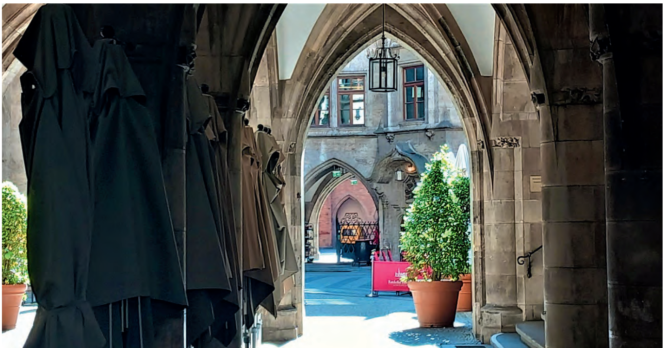
Una residenza gotica dei duchi di Baviera, all'ingresso sono appesi i sai dei monaci.

Da non perdere il museo della BMW: è uno spettacolo, generazioni di automobili di tutte le epoche sono in mostra e vengono fotografate come star da giovani, e meno giovani, visitatori.