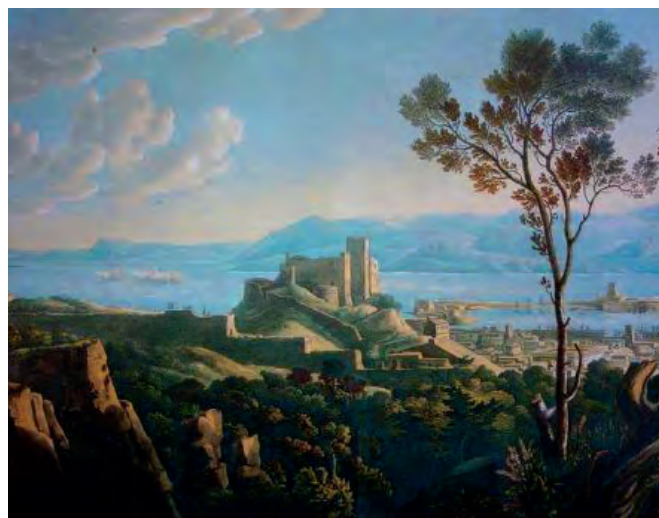
Un vecchio dipinto della fortezza Matagrifone

Ciò comportò una reazione che portò a degli scontri sanguinosi con diverse vittime da parte inglese. La reazione da parte di Riccardo fu altrettanto energica e la città fu saccheggiata ed incendiata. Riccardo costruì, o meglio ampliò, un'antica fortezza cui fu dato il nome di "Matagrifone" che stava a significare "ammazza i greci" (o Rocca Guelfonia, ovvero Rocca del re guelfo in quanto Riccardo sosteneva la casa di Sassonia).