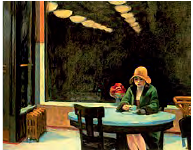
Edward Hopper, Automat

Una delle motivazioni potrebbe essere un innato bisogno di ricerca rivolta a ciò che non si vede, ma già qualcosa scalpita dentro di loro provocando una continua sperimentazione per lo più incompresa dalle frettolose vite altrui, già ampiamente soddisfatte di ciò che attorno vedono e vivono.