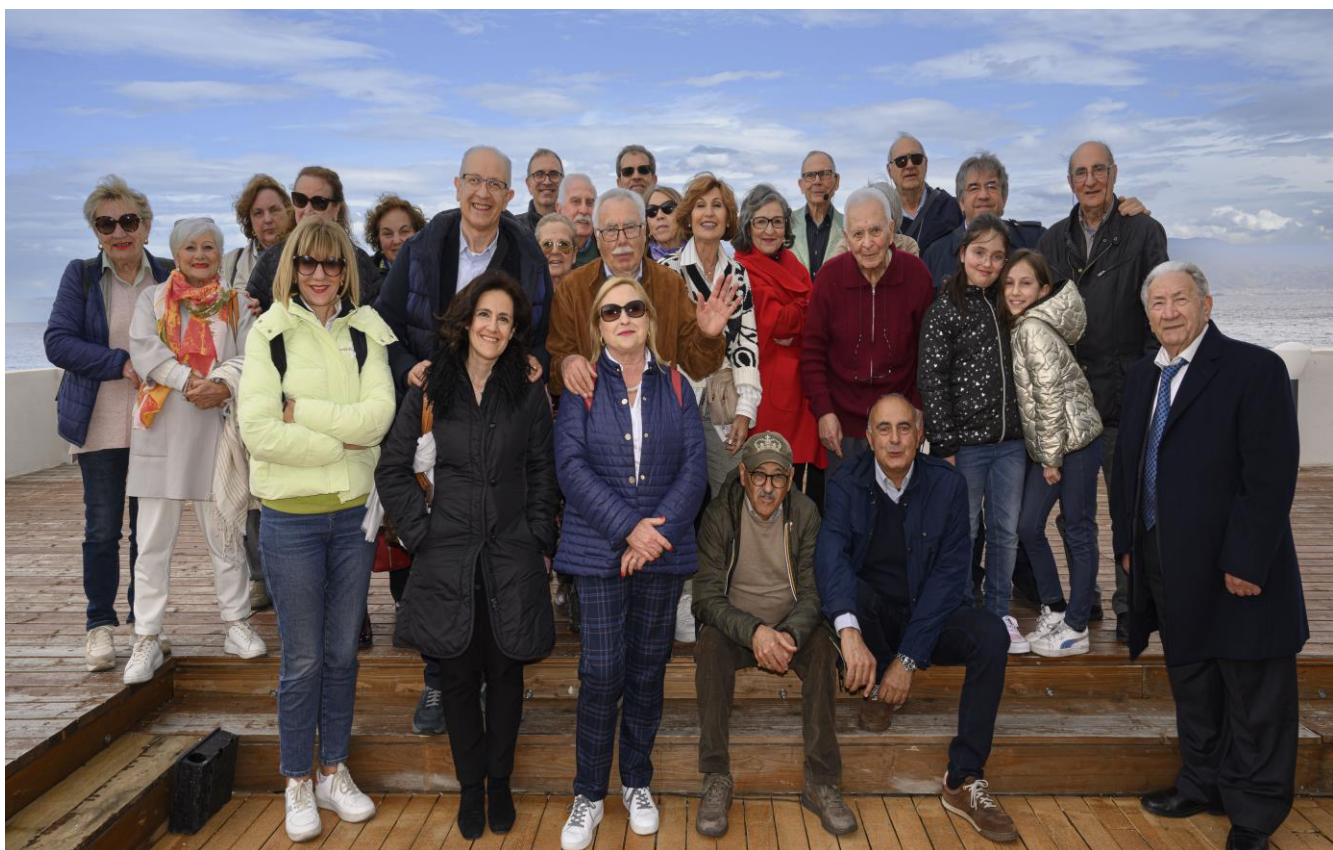
Foto ricordo scattata al ristorante "La Corte dei Mari" dove si è pranzato dopo l'interessantissima visita al Museo Regionale di Messina.